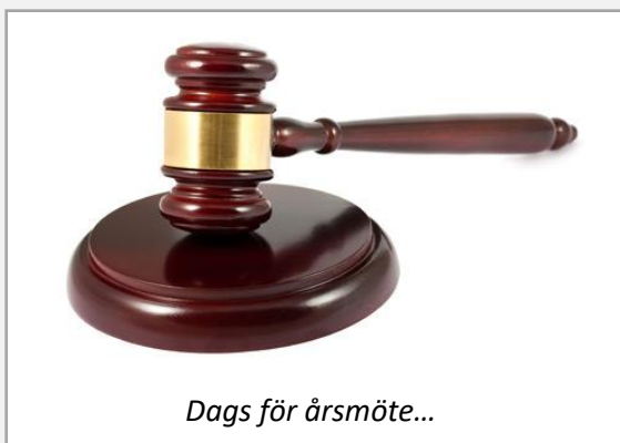
Dags för årsmöte...

Vi kommer även att servera kaffe/te med tilltugg.