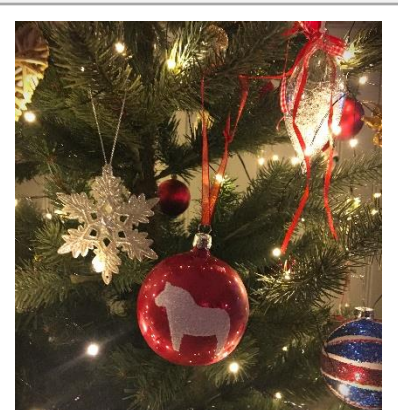
Jul, jul, strålande jul...