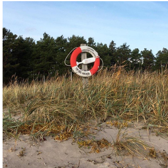
Sommar, sol och bad...

Hoppas ni alla får en trevlig midsommar och en skön sommar! Och att ni alla kan njuta av att vara ute och kanske se och upptäcka något nytt. Så ses vi till hösten igen!