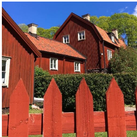
Vårutflykt på Södermalm...