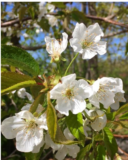
Våren är på ingång